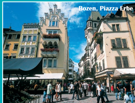
Bozen, Piazza Erbe