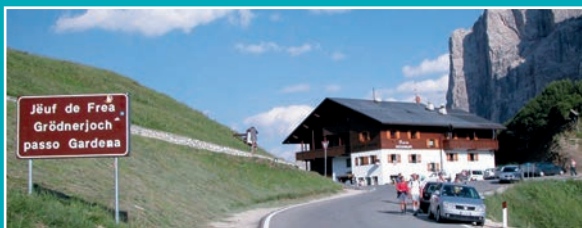
Jüf de Frea Grödnerjoch passo Gardena