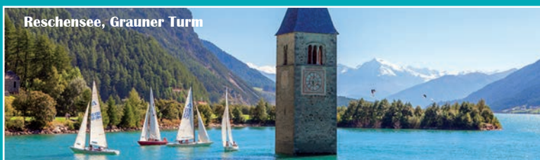
Reschensee, Grauner Turm

1. Tag: Anreise: Fahrt ins Südtirol, über Sterzing nach Brixen, mit einem Aufenthalt zur gemütlichen Besichtigung. Anschl. Fahrt zum 3*-Hotel Senoner, an ruhiger Lage im Ortszentrum von Spinges. Zimmerbezug, ansch. Abendessen.