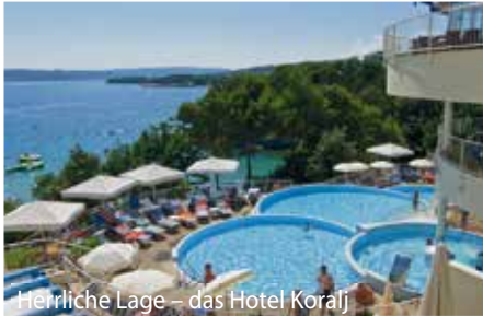
Herrliche Lage – das Hotel Koralj