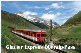
Glacier Express Oberalp-Pass